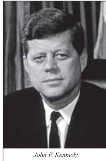
John F. Kennedy